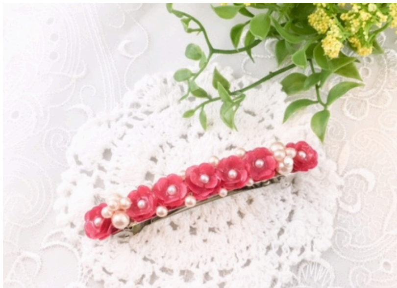
作品使用ペーパーNO.071