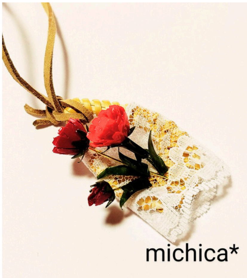
作品使用ペーパーNO.104 NO.68 NO.92