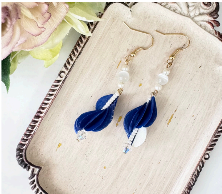
作品使用ペーパーNo.01 No.75